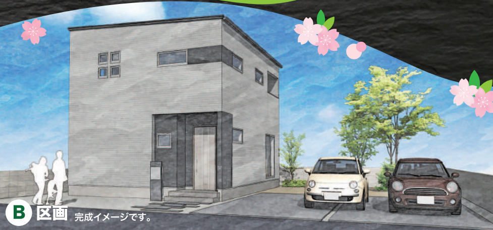
B 区画 完成イメージです。