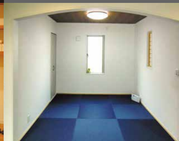
リビングと一体で使える畳コーナー4.5畳