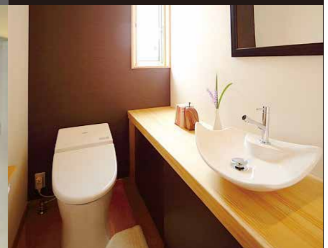
幅1.3mのスペースに大型のベッセル手洗いを設置