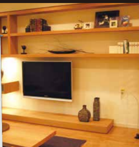
幅3.6mの壁に収納とTV台を製作

趣味のバイクをもっと楽しみたい、そんな希望を叶えた住まいが完成。高いデザイン性と暮らしやすさの両立が自慢です